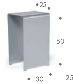
• 25 • • 50 • • 30 • 25