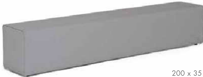
200 x 35