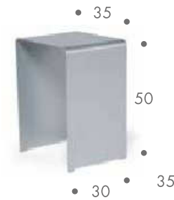
• 35 • • 50 • • 30 • 35