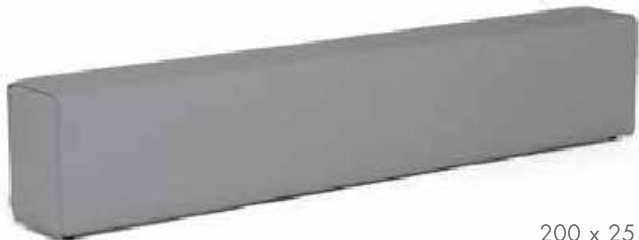
200 x 25