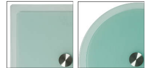
oberfläche glas unterseite gesandet