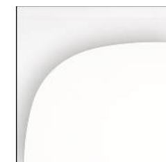
form twin platte